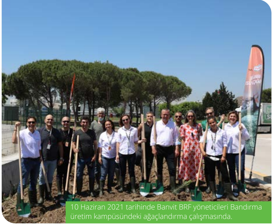
10 Haziran 2021 tarihinde Banvit BRF yöneticileri Bandırma üretim kampüsündeki ağaçlandırma çalışmasında.

Bandırma'daki ana üretim kampüsünde 2001 yılında devreye alınan katı ve sıvı arıtma tesisleriyle üretim sürecinde kullanılan tüm su arıtılarak çevreyle dost hale getirilmiştir. 2013 yılında ise ikinci önemli çevre yatırımı gerçekleştirilmiş ve "Atık Su Geri Kazanım Tesisi" devreye alınmıştır. Bu yatırım sayesinde bugün yıllık olarak arıtılan suyun ortalama %34'ü içme suyu kalitesinde geri kazanılmaktadır. Basit bir anlatımla, içme suyu olarak tüketilebilecek bu %34'lük dönüşüm oranıyla yaklaşık 5 bin hanenin bulunduğu ortalama 20 bin nüfuslu bir ilçenin yıllık kullanım ve içme suyunu geri kazanılmış olmaktadır.