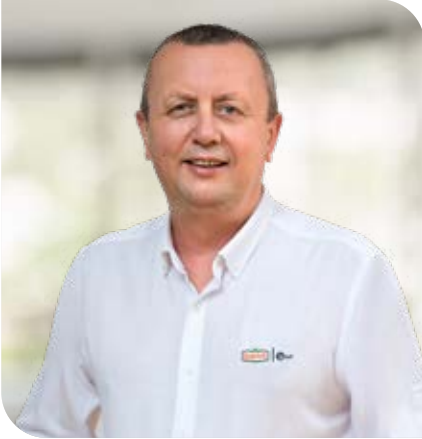
Nerdin Alp Satış Direktörü